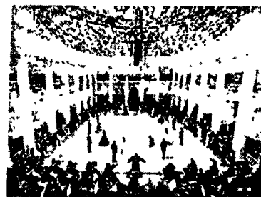
Tatler Бал дебютанток 2012